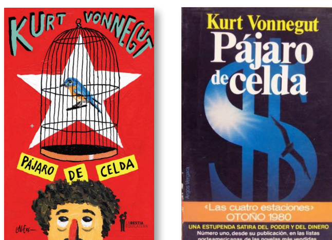
Figura 54. Izquierda: Kurt Vonnegut, Pájaro de celda (La Bestia Equilátera, 2015). Derecha: Kurt Vonnegut, Pájaro de celda (Argós Vergara, 1980). Ambas cubiertas expresan diferentes momentos e interpretaciones de la misma obra de Vonnegut.

Figura #. Izquierda: Autor, título (Editorial, año, URL). Derecha: Autor, título (Editorial, año, URL). Descripción